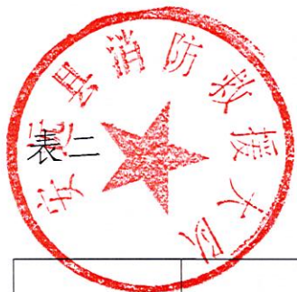
安远县消防救援大队2023年度行政许可实施情况统计表