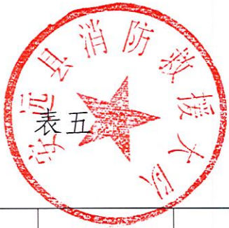
安远县消防救援大队2023年度行政检查实施情况统计表