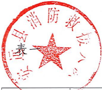
安远县消防救援大队 2023 年度行政执法总体情况统计表